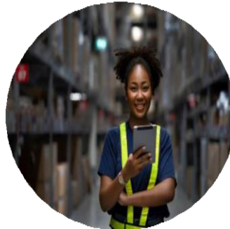
La chaîne d'approvisionnement verte