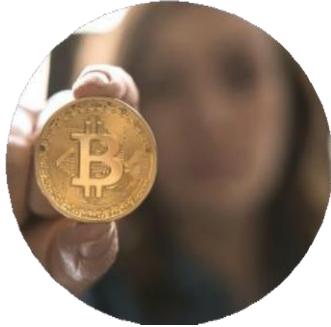
La chaîne de blocs (blockchain)