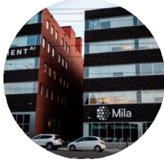
Télécommunications, Internet des objets, 5G