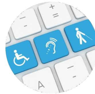
L'accessibilité dans la technologie