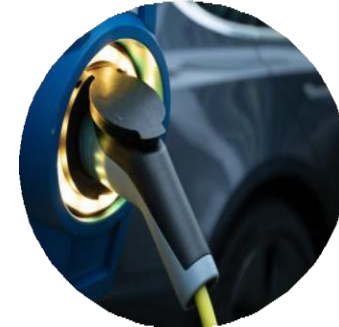
Les transports écologiques