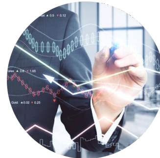
Les mégadonnées : fondements et impact