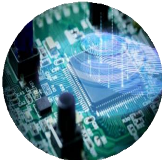
La transformation numérique