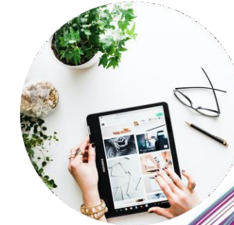
Le design de service