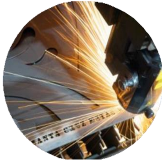
La fabrication de pointe et l'Internet des objets industriel