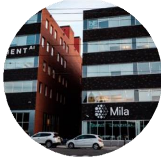
Télécommunications, Internet des objets, 5G