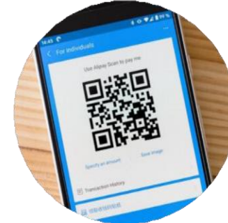
La vente au détail et le commerce intelligents